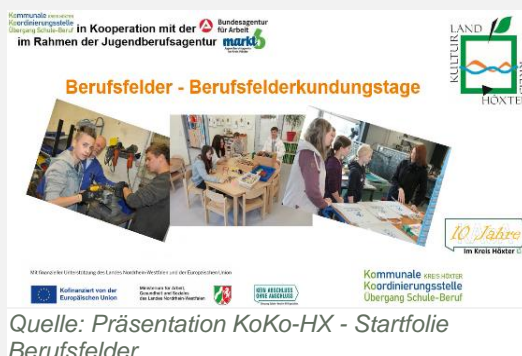
Quelle: Präsentation KoKo-HX - Startfolie Berufsfelder

Diese digitalen Veranstaltungen umfassen mittlerweile eine breite Themenpalette vom Einstieg in die Berufliche Orientierung mit Erklärung der einzelnen Berufsorientierungselemente über die Entscheidung für eine Ausbildung oder weitere